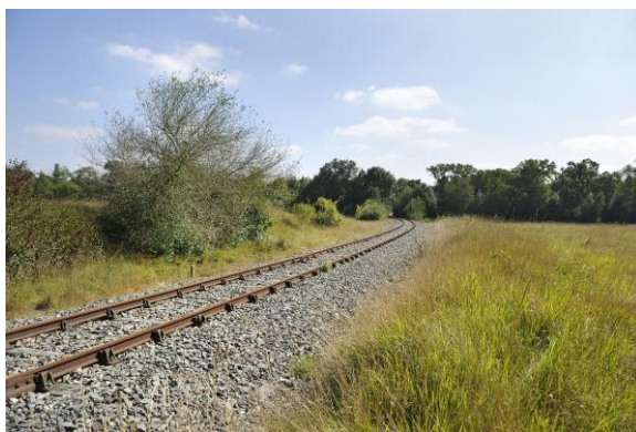
La ligne ferroviaire Chartres-Orléans dans le secteur de Fontenay-sur-Conie.

De nombreuses attentes et suggestions ont par ailleurs été formulées sur les temps de parcours, les horaires et la fréquence des trains, les correspondances, les prix du billet, etc.