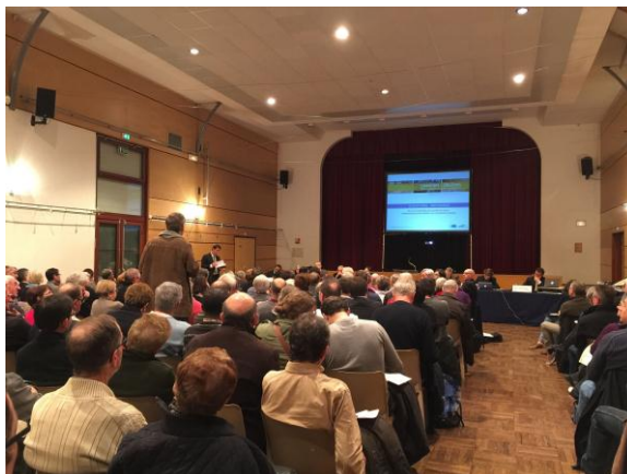
Réunion publique à Ingré.

Le nombre total des contributions (écrites et orales) est de 622 . Ces contributions émanent d'un nombre estimé à 602 contributeurs , en majorité originaires des communes directement concernées par le projet.